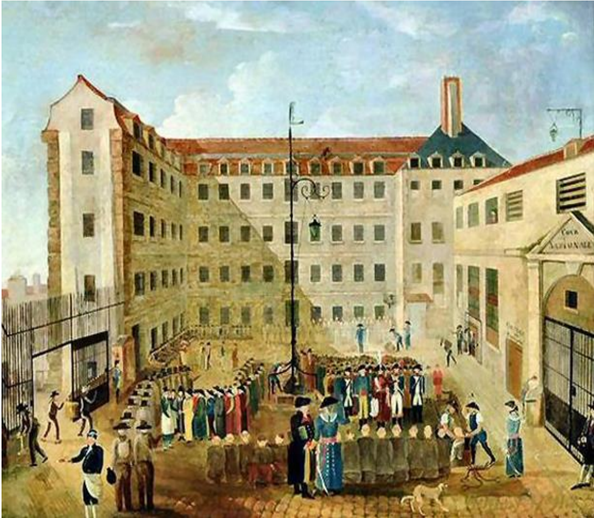
Figure 1 : « Le ferrement des prisonniers à Bicêtre », huile de Louis Léopold Boilly, 1791.